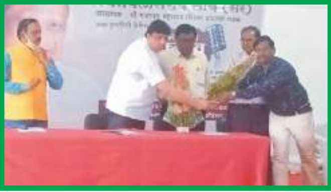
ज्ञान विलास वक्तृत्व स्पर्धेत मान्यवरांचा सत्कार