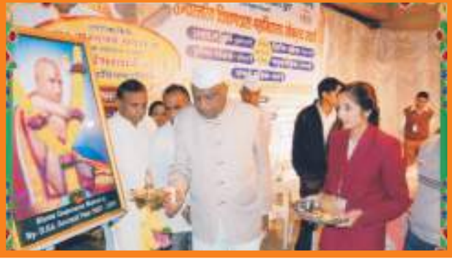
राज्यस्थरिय शिक्षणशास्त्र महाविद्यालय लोकनृत्य स्पर्धेचे उद्घाटन