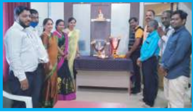
युवक दिन व जिजाऊ जयंती