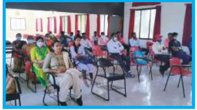
बी. एड. प्रथम वर्ष स्वागत समारंभामध्ये उपस्थित विद्यार्थी