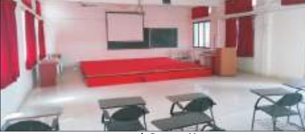
सुसज्ज सेमिनार हॉल