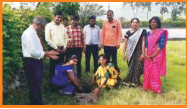
महाविद्यालय परिसरात वृक्षारोपण करताना