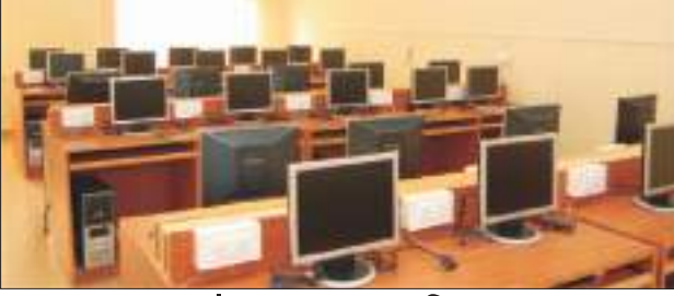
संगणक व wi-Fi सुविधा