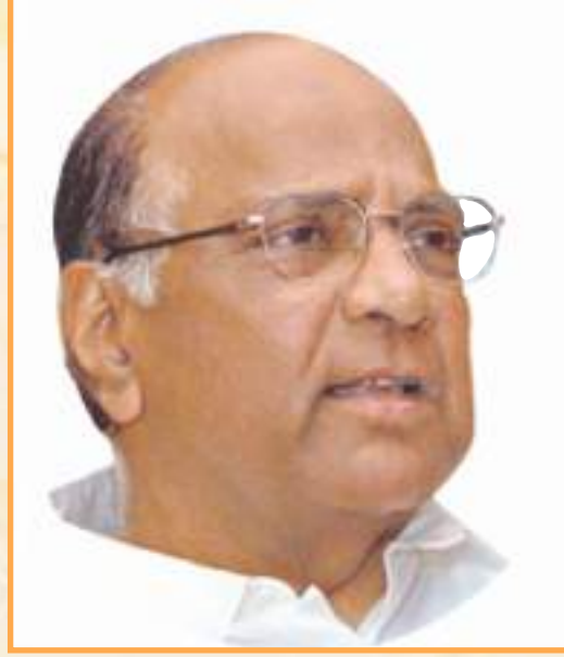
आदरणीय मा. शरदचंद्रजी पवार साहेब मा. कृषी मंत्री, भारत सरकार