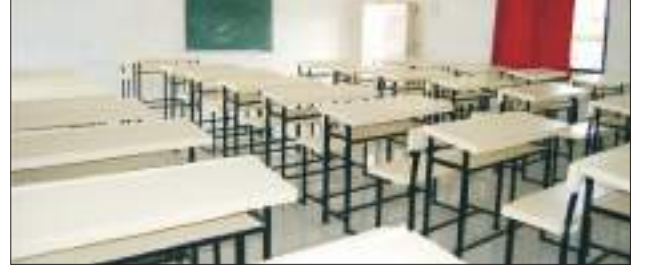
प्रशस्त अध्यापन कक्ष