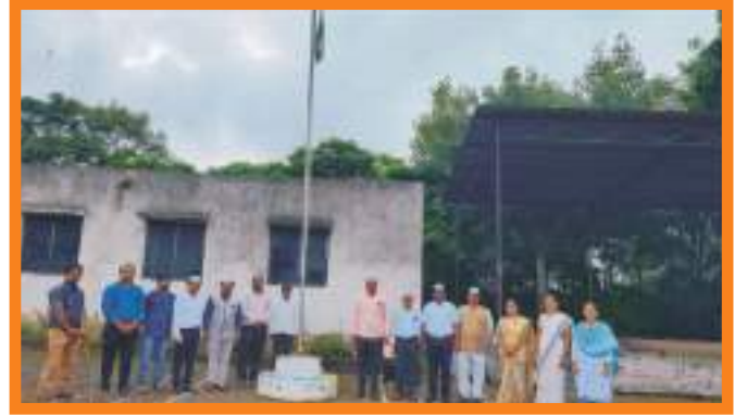
प्रजासत्ताक दिन २०२१