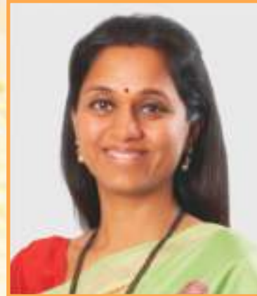
मा. सौ. सुप्रियताई सुळे खासदार - बारामती