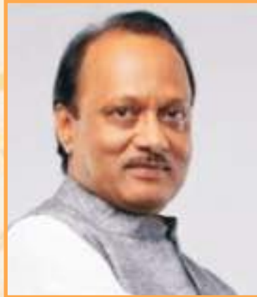
मा. ना. अजितदादा पवार साहेब उपमुख्यमंत्री महाराष्ट्र राज्य