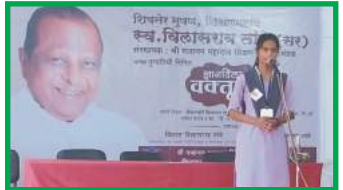
ज्ञान विलास वक्तृत्व स्पर्धेत सादरीकरण करताना सहभागी विद्यार्थी