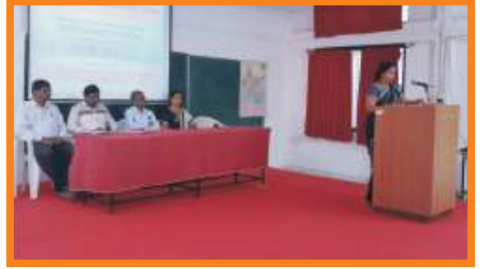
शालेय व्यवस्थापन पदविका संपर्क सत्र