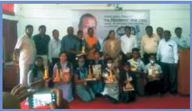
ज्ञान विलास वक्तृत्व स्पर्धेच्या विजेत्यांसह मान्यवर