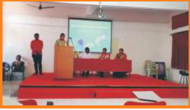
बी. एड. प्रथम वर्ष स्वागत समारंभामध्ये उपस्थित मान्यवर