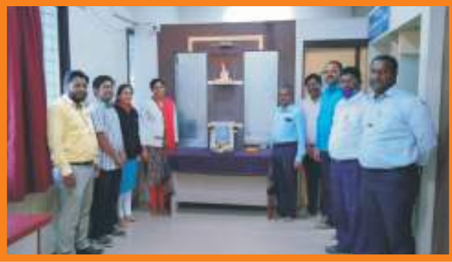
नेताजी सुभाषचंद्र भोस जयंती