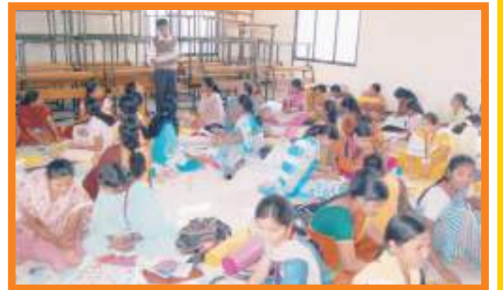
शैक्षणिक साहित्य निर्मिती कार्यशाळा